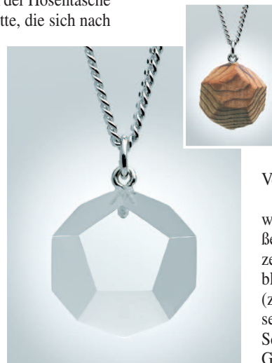
Energiestern in Acryl oder Zedernholz.

Von Kunden genannt werden: Mehr Energie, größere Wachheit, mehr Konzentration, besserer Durchblick, mehr Selbstsicherheit (z.B. gegenüber dem Vorgesetzten), ein Gefühl des Schutzes, mehr Toleranz, Gelassenheit, Heiterkeit, mehr Bereitschaft zu verzei-