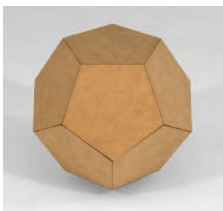
Im Dodekaeder finden sich alle platonischen Körper und über 720 Goldene Schnitte.