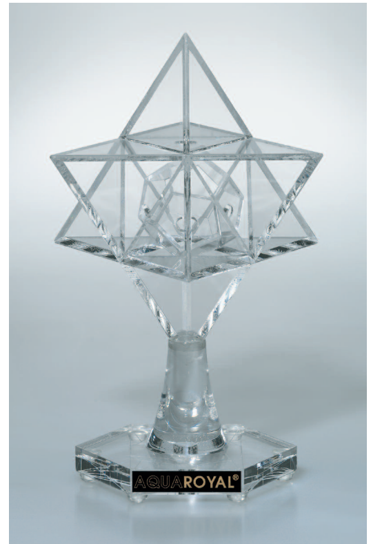
Der edle Raumstern schützt das ganze Haus

Als Werkstoff entschied sich Vogel für das energieneutrale Acrylglas, das sich sehr gut eignet, um mit natürlichen Schwingungsinformationen aufgeladen zu werden. Der kleine Ener-